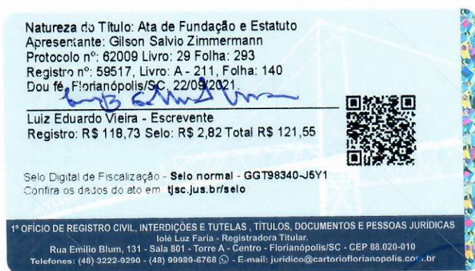
Luessa de Simas Santos OAB/SC 31.104